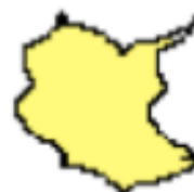
A tessellating shape is formed