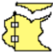
cut second plain side