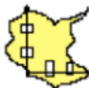
tape to opposite side