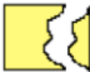
cut one side