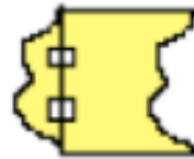
tape to opposite side